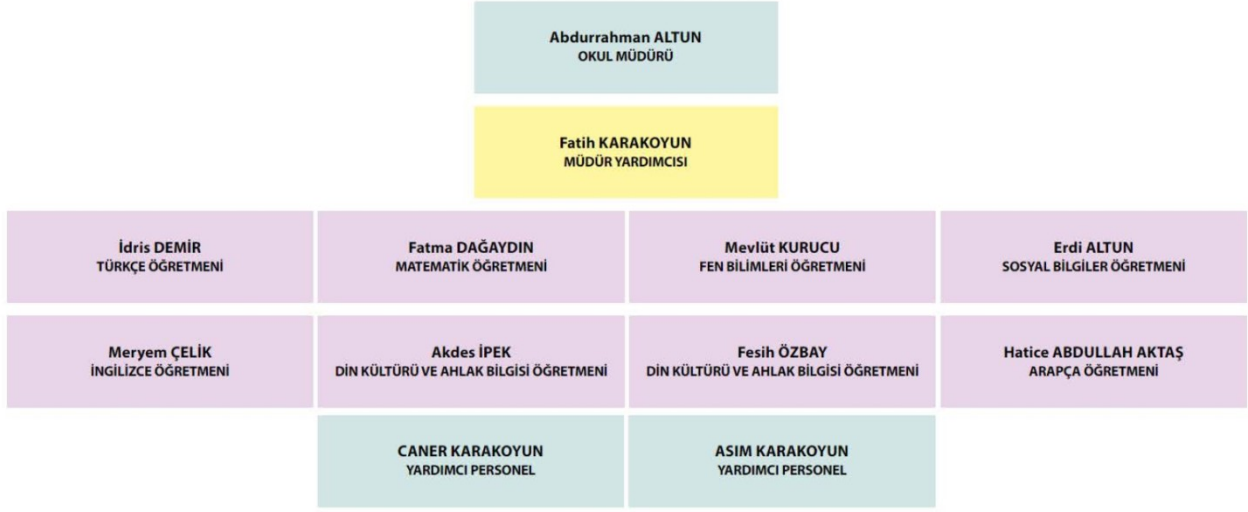
Şekil 1. Teşkilat Yapısı Şeması

Teşkilat şemamız ve personel bilgileri aşağıda verilmiştir.